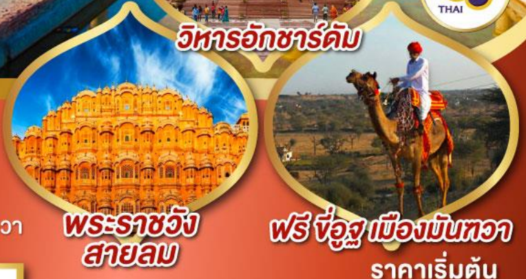
วิหารอักซาร์ดัม